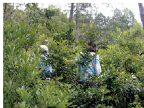
「植樹後2年経過した 苗の成長」 2009年7月撮影