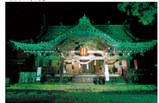
「筑波山神社」