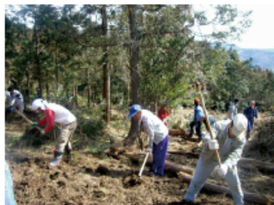
「開墾作業」 2007年5月撮影