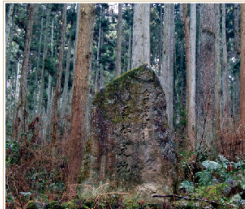
筑波山北西麓にある「昭和9年、全国緑化行事発祥の地」記念碑(桜川市)